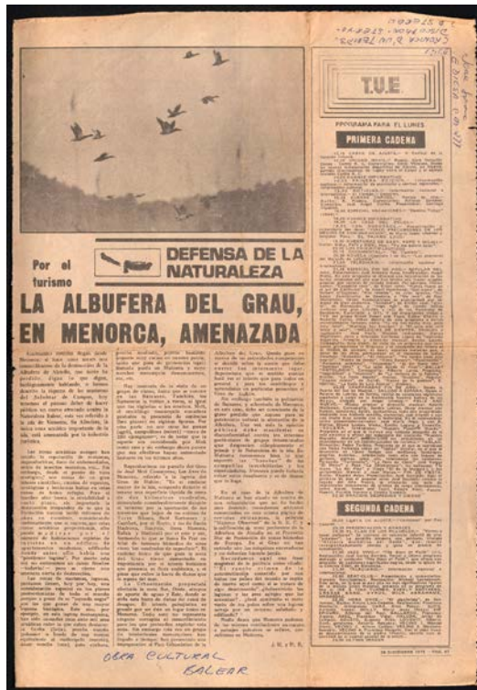
Foto 5. Diario de Mallorca, 31/12/1973.

a finals del franquisme i durant la Transició (ecologisme, feminisme, moviment veïnal i sindical...). Les entrevistes als protagonistes també ens obren la porta a la localització de nous arxius particulars, ja que acaben sent descoberts arran de les converses amb els seus protagonistes.